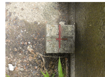
ZK22 : コンクリート杭

< 本仮測量図作成の前提条件および取扱上の注意事項 > 図中境界以外の情報(建築線・用途地域線・都市計画等)においては、令和6年6月7日時点で、当該関係部署にて確認した情報ではありますが、申請者様また設計者様(資格者様)において、改めて内容確認の上建築確認申請にご使用ください。 この図面は、隣地境界未立会いの仮の測量図です。 境界点、辺長及び地積等に変更の可能性があります。 道路境界線については暫定です。当該役所担当課への相談・確認申請等が必要です。 相談・確認申請等により道路境界線の算出方法が変更となった際には境界点、辺長及び地積等に変更の可能性があります。 本図では周辺の土地境界図を暫定再現し作成しております。 越境物の確認は目視によるものです。 境界未立会の為、越境範囲は明確ではありません。