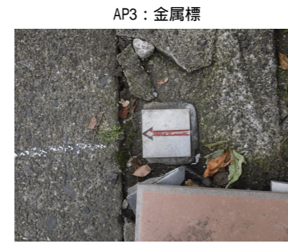
AP3 : 金属標