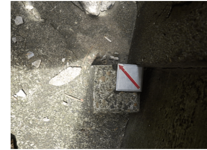
ZK20 : 金属標